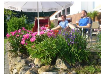
Zuschauen ist so entspannt