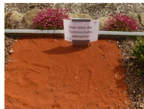
Das besondere Örtchen