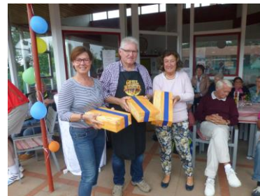
Belohnung für fleißige Helfer