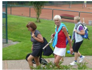
Die 3 vom Platz 3