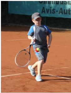
So wird's gemacht