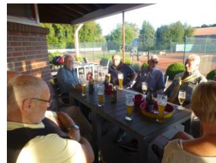
Immer wieder montags