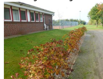
Kastanienallee im Herbst