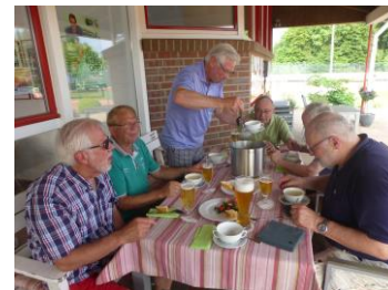
Ist noch Suppe da?