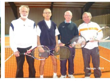
300+ Jahre Tenniserfahrung