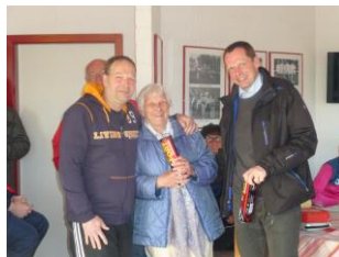
Eröffnung - Siegerehrung