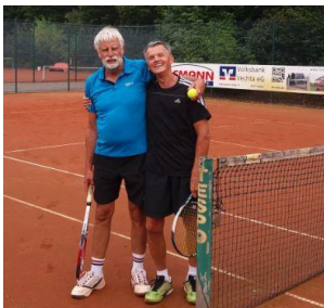
VM - nach dem Match