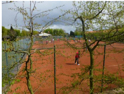
Der Mai ist gekommen... Eröffnung