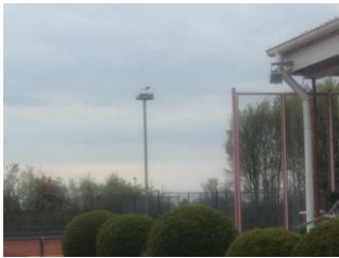
Kurzbesuch eines Storchs