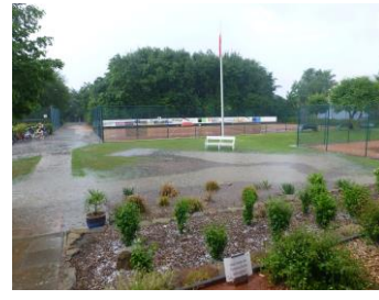
Plätze und Land unter ...