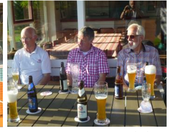
Lecker Weizen - mit und ohne