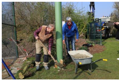
Malochen für den Storch