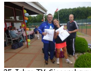
25 Jahre TV-Siegerehrung