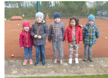
VM junge Medallienträger