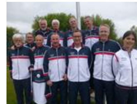
Damen 40 - Dezember 2016 - mit Trikot-Sponsor A.Schlüsche - Herren 55 I - April 2016