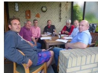
Vorstandssitzung - Outdoor