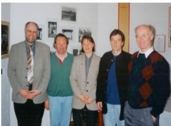
Vorstand TV Vechta 1998 (vor 20 Jahren)

Malerfachbetrieb Aulike Tel. 9778-0 – Fax 9778-18 www.aulike.de